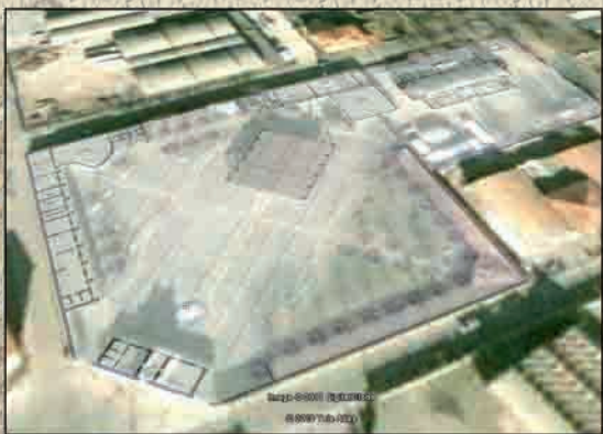
Immagine aerea del Complesso “Foro 2000”

“Militaria al Foro” è la prima mostra mercato di militaria organizzata in provincia di Parma. Ospitata all'interno del Complesso Civico Culturale “Foro 2000”, l'evento coinvolgerà professionisti e privati collezionisti in una superficie di oltre 1.600 mq (area coperta ed esterna) che avranno la possibilità di condividere, acquistare, cedere e scambiare oggetti, decorazioni, documenti e cimeli del passato appartenuti un tempo alla storia militare.